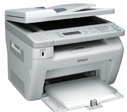
Epson AcuLaser MX14NF 1 Modell mit Druck-, Kopier-, Scan- und Fax-Funktion